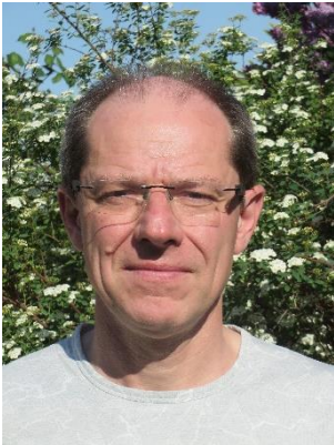
Agro-économiste au sein de l'unité de recherche Environnement et Territoire du centre de recherche Irstea de Bordeaux

Titulaire d'un diplôme d'Ingénieur agronome (Bordeaux Sciences Agro, 1988), d'un Master Recherche en Sciences de gestion (2004, IAE Université de Bordeaux) et d'un Doctorat en économie de l'agriculture et des ressources (2011, Agrocampus-Ouest).