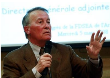
Ancien Ministre de l'agriculture

Remise des prix 2012 sous le parrainage de M. Henri Nallet, ancien ministre de l'agriculture.