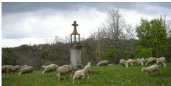
Ferme des Lizettes 24 440 MONSAC.