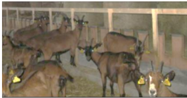
Chemin de l'Agueria - 64270 BERGOUEY-VIELLENAVE