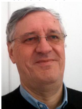
Directeur régional BAYER Cropsience (en retraite)

Fils d'agriculteur picard. Maîtrise de science en Physiologie végétale (Université Pierre et Marie Curie. Paris). Expérience technique et commerciale en agrofournitures : Nord-Pas de Calais / Bourgogne/ Midi Pyrénées / Charentes et Aquitaine.