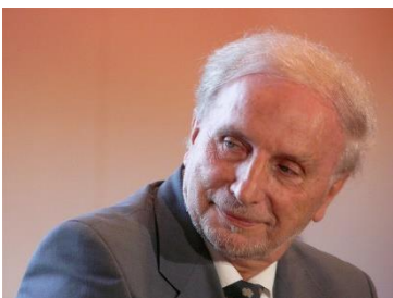
Professeur titulaire de la chaire d'agriculture comparée et de développement agricole de l'Institut national agronomique Paris-Grignon

Intervenant conférencier lors de la remise des prix 2011