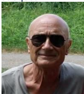
Ingénieur R&D chez ARVALIS-Institut du Végétal (en retraite)

Fils de Viticulteur Charentais. DEA Génétique et Amélioration des Plantes. Université PARIS XI- ORSAY. Généticien au CIRAD sur programme COTON au Sénégal de 1975 à 1981. Administrateur de l'AFDI Nouvelle-Aquitaine (Agriculteurs Français et Développement International).