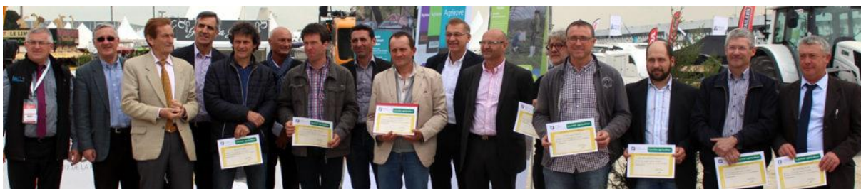
Remise des prix 2016