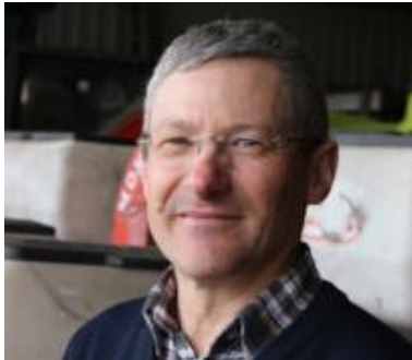
Rion des Landes (40)